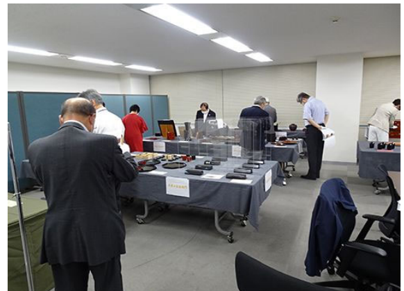
審査風景(産業工芸品部門)