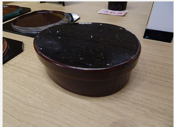
審査員特別賞 [本堅地 堆朱弁当] 瀧澤直樹(木曾漆器)

左右にある菱形の意匠が、強いアクセントになっている。造形としての緊張感が素晴らしい。盛り台としての使い方も良さそう。お刺身やお寿司など、一人前ずつという使用も良いが、テーブルの中心に高さを加える為の盛り台として使用すると、食のテーブルを華やかに演出出来るだろう。