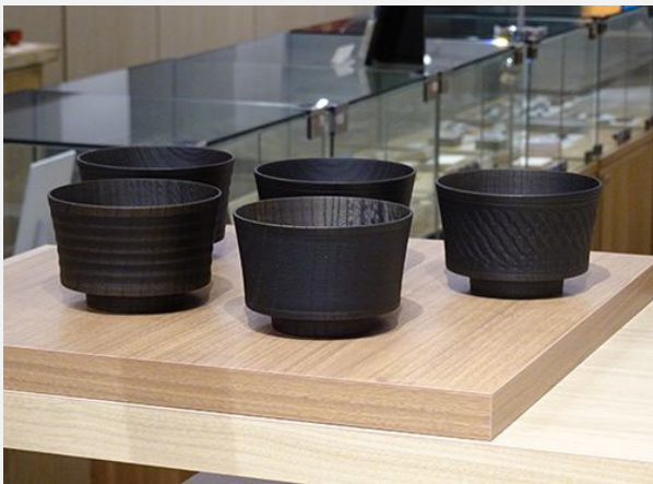
奨励賞 [櫛 加飾碗 black (5種) 挽筋、盛筋、平筋、ピリ筋、乱筋] 株式会社我戸幹男商店(山中漆器)

好みはあるかと思うが、価格的にも市場性はあると思う。部門審査員からは、デザインが少し古典的であり、もう少し今好まれるデザインでも良かったのでは、という意見も。