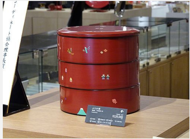
NPO 法人食空間コーディネート協会賞 [ふくもの重] 吉田漆器工房(輪島塗)

今、新型コロナウイルス対策として店舗等に仮設パーティーションを多く見かけるが、常設に耐えうる見た目のものが徐々に求められていると感じる。そんな折、新しい生活様式にも日本の伝統工芸である漆の可能性を主張することは、社会において活躍の場を見出すという点に於いてとても重要に思う。