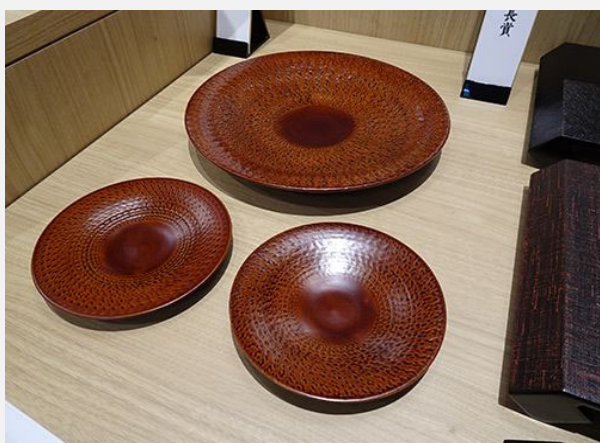
株式会社商工組合中央金庫社長賞 [漆陶 さざなみ彫皿 3枚セット] 株式会社土直漆器(越前漆器)

デザイン的にもとても優れている。新しさの中に、伝統がしっかりと入っている。個人としても、会食の場でも使用出来る柔軟性を感じる。部門審査員一押しの作品。皆が“欲しい”と言っていたのが印象的。産業工芸品ということで、欲しいと思わせる商品の力、とても大事なことだ。