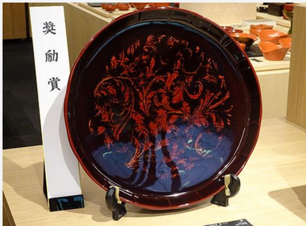
奨励賞 [乾漆盛器 麗(レイ)] 木村貞夫(越前漆器)

広く底面を持ち、縁はわずかに輪花となる形状が美しい。内側には金箔で大きな木立を表現し、その上に木地呂漆を塗り、研ぎ仕上げで中の金箔を見せる。使いながら鮮やかに出てくる模様を楽しみたい。