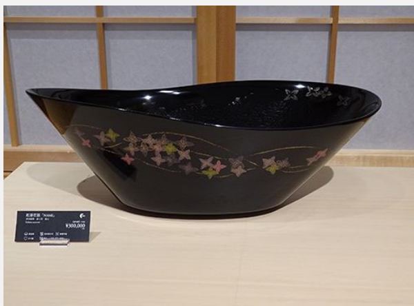
奨励賞 [乾漆花器「NAMI」] 漆工房 北山(香川漆器)

裏表とも実に丹念に表現されている。金蒔絵のオカメインコの愛らしさと青緑色のみの貝の貼り込みの対象が美しい。どこを取っても細部まで神経がゆき届き作者の美意識の高さを感じさせる。