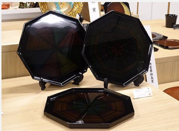
経済産業大臣賞 [八角盆(彩) 3点セット] 畑勝日佐(高岡漆器)

産業工芸部門の中でダントツの1位。とても綺麗というのが、部門審査員皆の意見。料理も盛りやすそうだし、料理が映える。日常でも、とても使いやすいそう。盆を重ねた時の重なりも良く、日頃の使用についてもしっかりと考えられている。一セットと言わず、来客の分も含めて複数枚欲しくなる。