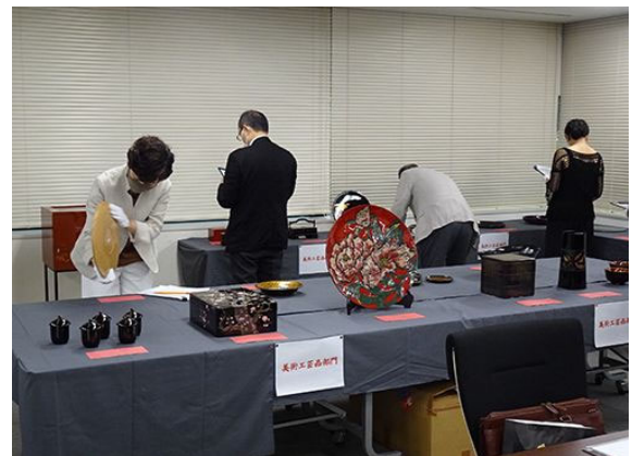
審査風景(美術工芸品部門)