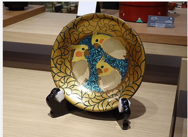
奨励賞 [オカメインコ蒔絵飾皿] 株式会社うるしアートはりや(山中漆器)

広く底面を持ち、縁はわずかに輪花となる形状が美しい。内側には金箔で大きな木立を表現し、その上に木地呂漆を塗り、研ぎ仕上げで中の金箔を見せる。使いながら鮮やかに出てくる模様を楽しみたい。