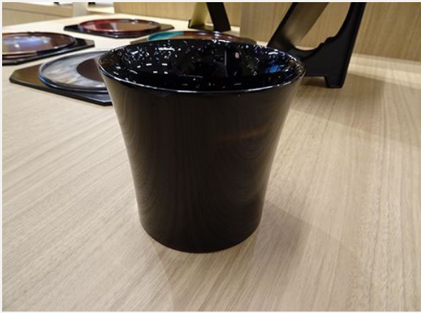
奨励賞 [マイカップ] 利山(川連漆器)

工芸品は新規性だけに囚われることなく、凜として欲しいと思う。その気持ちがかたちとなって目の前に表れたという印象。こういう世界、好きだなー、と素直に思えた。全体のデザインも優秀だが、内側の螺鈿がとても綺麗。人と接する、カップとして最も重要な部分にこういうデザインを散りばめるセンスが素晴らしく、細部まで気を遣って造られていると感じる。軽さも印象に残る。これは、欲しい。