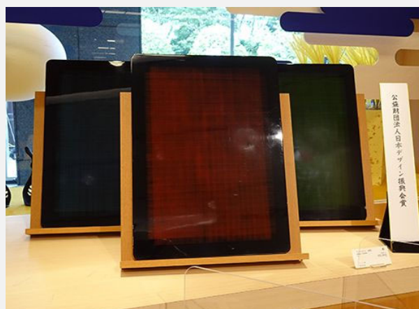
公益財産法人日本デザイン振興会賞 [ランチョンマット 紬塗] 氏家漆器株式会社(高岡漆器)

越前焼に漆を塗るという独自の技法が目飛び込む。伝統の中に新しい挑戦を盛り込む。彫りによる高低差を利用して漆塗の濃淡をマチエールとして使い、美しくも新しいデザインの世界を見事に切り拓いた。