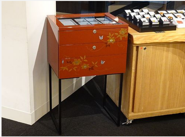
一般社団法人日本百貨店協会会長賞 [「あざみ五」アクセサリチェスト] 株式会社森繁(香川漆器)

金属製の瀟洒な足が三段の引き出しを掲げる姿は印象的である。前面にテッセンが蒔絵をされ、内側はアクセサリ、時計などが収納ができるように、小さく区切られている。