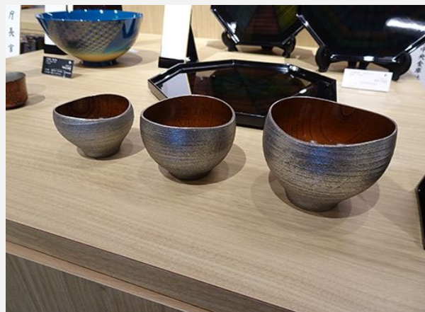
経済産業省 製造産業局長賞 [樺 三つ組 ゆらぎボール 銀嵯美] 有限会社中出漆器店(山中漆器)

産業工芸部門の中でダントツの1位。とても綺麗というのが、部門審査員皆の意見。料理も盛りやすそうだし、料理が映える。日常でも、とても使いやすいそう。盆を重ねた時の重なりも良く、日頃の使用についてもしっかりと考えられている。一セットと言わず、来客の分も含めて複数枚欲しくなる。